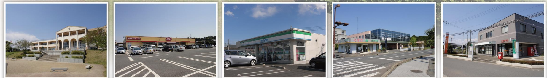
稲荷第一小学校 カスミ ファミリーマート 東前病院 東前郵便局