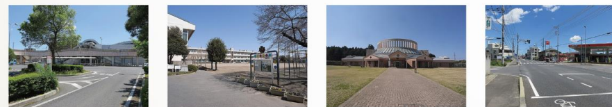
赤塚駅 約1000m・徒歩約13分 石川小学校 約670m・徒歩約9分 西部図書館 約800m・徒歩約10分 国道50号 約540m・徒歩約7分