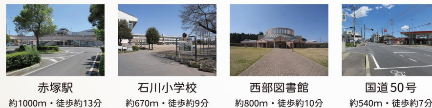
赤塚駅 約1000m・徒歩約13分 石川小学校 約670m・徒歩約9分 西部図書館 約800m・徒歩約10分 国道50号 約540m・徒歩約7分