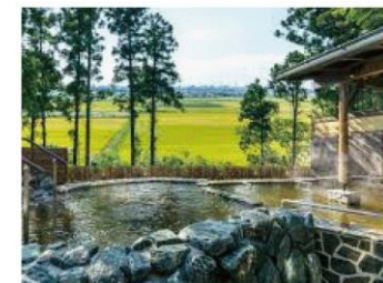
ひたちなか温泉 喜楽里別邸