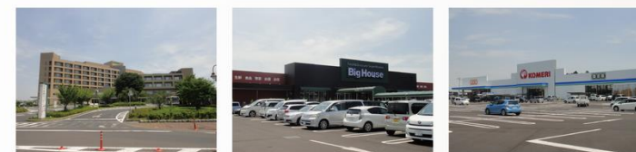
水戸医療センター ビッグハウス コメリ