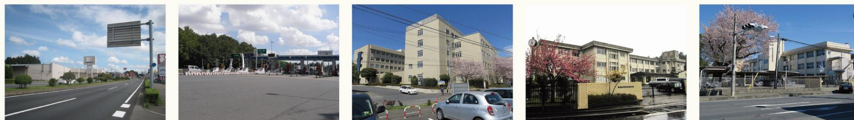
国道 50 号バイパス

国道 50 号バイパスから少し入った閑静な住宅街。双葉台団地にも隣接。お買い物施設や病院も近くにある便利な場所です。