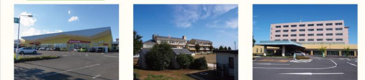
ヨークベニマル 稲荷第二小学校 水戸中央病院