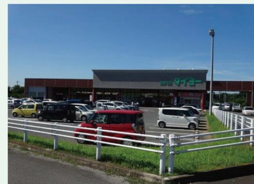
スーパータイヨー美野里店