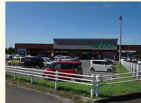
スーパータイヨー美野里店