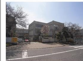
千波小学校 約1090m・徒歩約14分