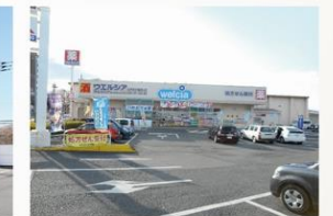
ウエルシア 約700m・徒歩約9分