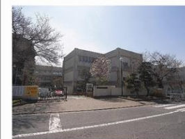
千波小学校 約1090m・徒歩約14分