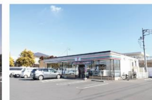
セブンイレブン 約430m・徒歩約6分