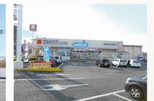
ウエルシア 約700m・徒歩約9分