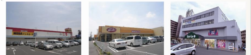
MEGA ドン・キホーテ フードストッカー セリア