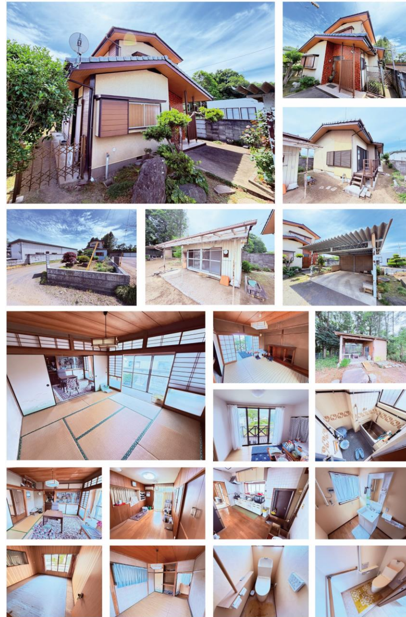
※図面と現況が異なる場合は現況を優先させていただきます。